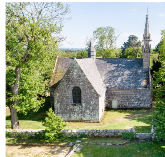
La chapelle des Sept-Saints.