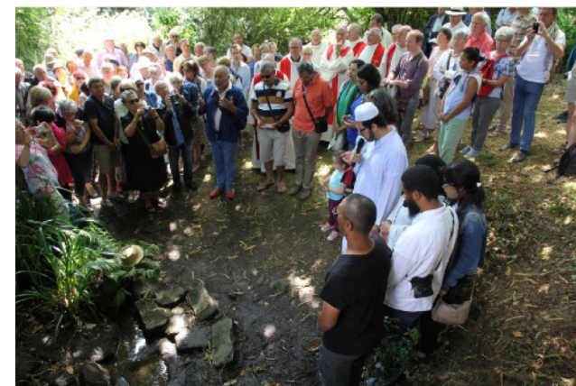
La lecture de la sourate des Gens de la Caverne (pardon 2019).