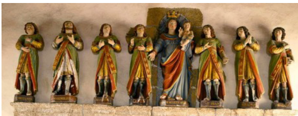
Les sept statues des Dormants d'Éphèse de la chapelle.